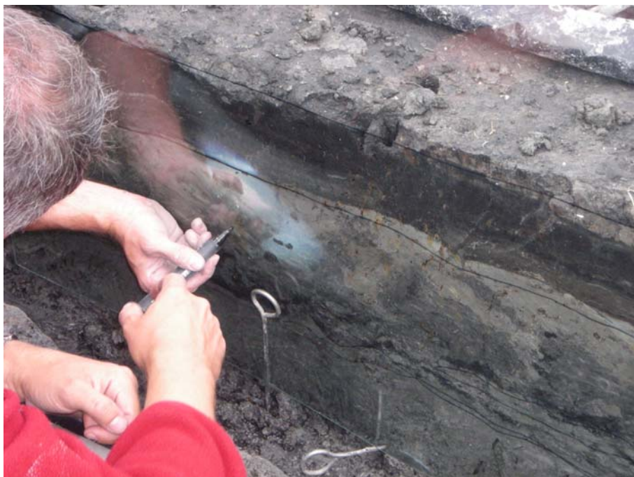
Profielwand wordt op plexiglas getekend, S4 2007.

Verder onderzoek moet natuurlijk nog volgen, maar als het inderdaad overtuigend aangetoond kan worden is weer een stukje van de archeologische puzzel van Noord-Nederland op zijn plaats gelegd voor wat betreft de Swifterbantcultuur.