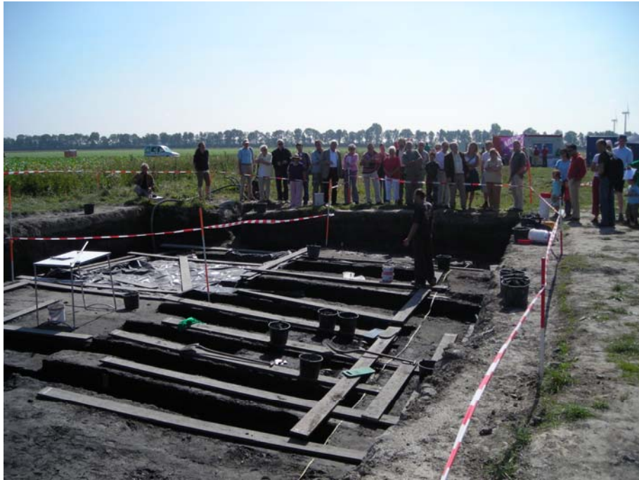
Bezoekers van de open dag bij de put, S4 2007.