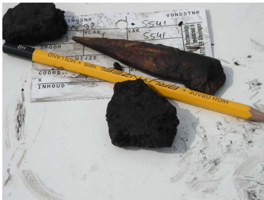
Benen priem en aardewerkscherven, S4 2007.

Te denken valt aan toenemende spanningen in samenlevingen door grotere verschillen in bezit. Het voedselpakket kan eenzijdiger worden. De organisatie van de samenleving wordt ingewikkelder. Er is een ander leiderschap nodig met waarschijnlijk meer en grotere hiërarchische verschillen tussen mensen. Omdat meer mensen dicht op elkaar wonen neemt de kans op besmettelijke ziektes toe. Door het intensieve contact van mensen met gedomesticeerde dieren worden bepaalde ziektes sneller en vaker op mensen overgedragen. Ook kan het natuurlijk evenwicht door de mens verstoord worden. Denk aan verzilting van de bodem bij langdurige irrigatie en de ontbossing van streken voor de landbouw met kans op bodemerosie.