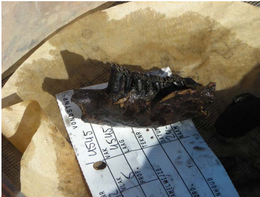
Beverkaak, S4 2007.

Uit eerdere informatie van de nabij gelegen vindplaats S3 blijkt dat de Swifterbantmensen, die gebruik maakten van rivierduinen en oeverwallen, gevarieerd aten. Ze visten op onder andere zalm, steur, karper, snoek, zeelt, voorn en meerval. Ze verzamelden bessen en noten. Ze jaagden op herten en wilde zwijnen, watervogels, bevers en otters. Ze hielden runderen en varkens en aten granen als naakte gerst en emmertarwe.