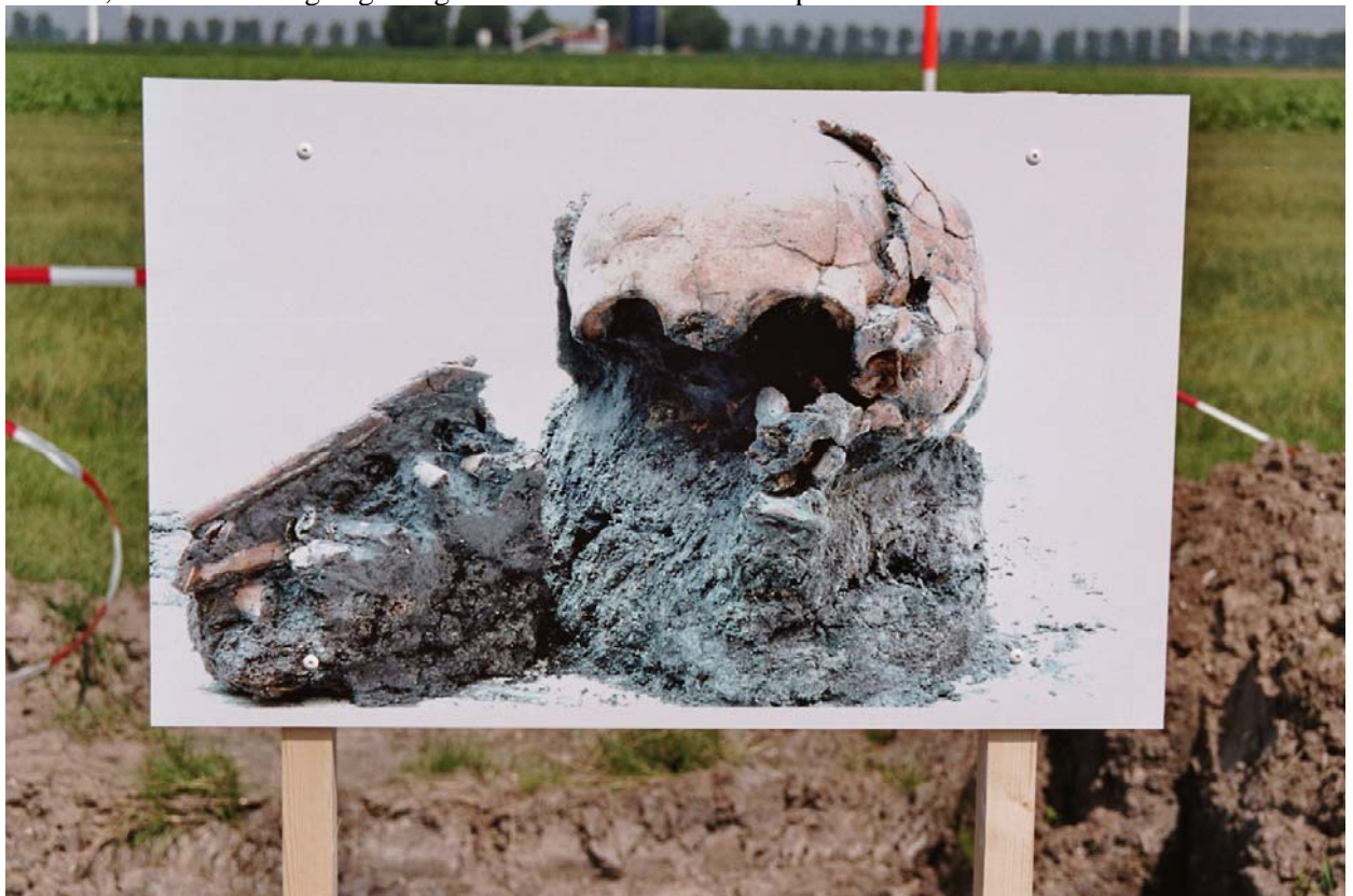
Informatiebord met kinderschedel bij vindplaats S4 in 2006.

Kortom, onderzoeksvragen genoeg verband houdend met vindplaats S4.