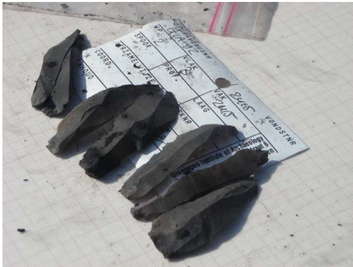
Vuurstenen afslagen, S4 2007.